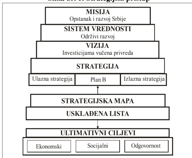
Slika br. 1: Strategijski pristup

Izvor : Đuričin D.: Tranzicija, stabilizacija i održivi razvoj: perspektive Srbije. Ekonomski fakultet. Beograd. DELOITE str. 19